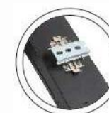
Instalación tipo rail universal